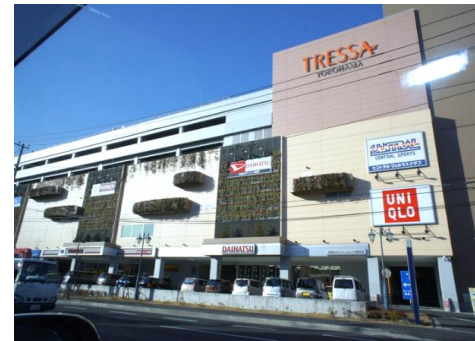
複合施設トレッサまで徒歩3分