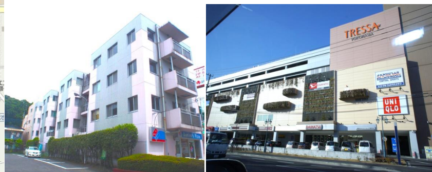
複合施設トレッサまで徒歩3分